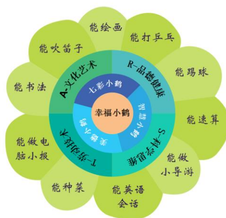
“幸福小鹤”校本课程一览表